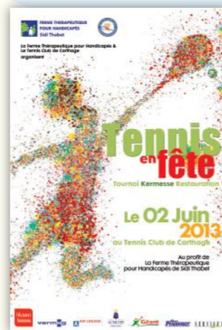
TENNIS EN FETE 2013 Tournoi de tennis à Carthage