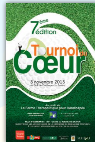
le 3 Novembre, la 7 ème édition du tournoi du cœur organisé cette année, au Country Carthage Club de golf de la Soukra.