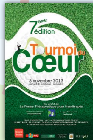
le 3 Novembre, la 7 ème édition du tournoi du cœur organisé cette année, au Country Carthage Club de golf de la Soukra.