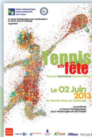
TENNIS EN FETE 2013 Tournoi de tennis à Carthage